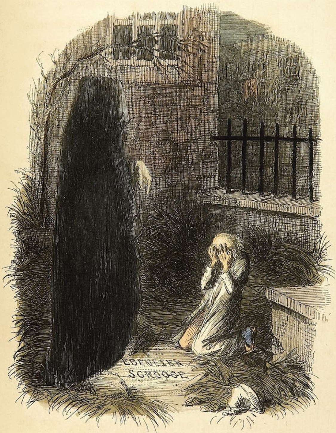
The Last of the Spirits.